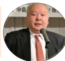
加藤一二三 (名棋士)

★全力投球でやってきた結果なので、1000敗も恥ずかしくはない。 ★人間的な深みが増すにつれ、将棋にも円熟味が出てくる。将棋をやる体力も30歳と60歳とではそれほど関係ないはずです。